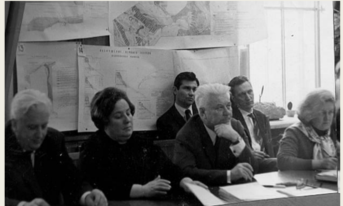
Кафедральное собрание. МГУ, начало 1970-х гг.