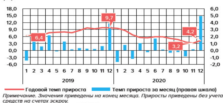
ДИНАМИКА ВКЛАДОВ ФИЗИЧЕСКИХ ЛИЦ (%)

2. По данным Банка России объем вкладов населения за 2020 год сократился на 7% до 21,2 трлн. рублей. А также произошло изменение в структуре средств физических лиц: за последние 2 года уменьшилась доля вкладов физических лиц сроком от 31 дня до 1 года и свыше 1 года на 13,1%, и выросли показатели по средствам физических лиц на счетах, с которых они могут быть в любой момент потрачены на покупки товаров или валюты.