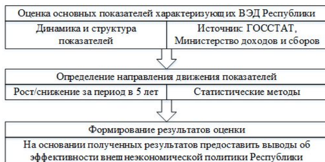
Рис. 1. Рисунок 1. Этапы осуществления оценки эффективности ВЭД ДНР