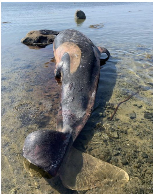
Рис. 1. Труп косатки, использованный для взятия образца