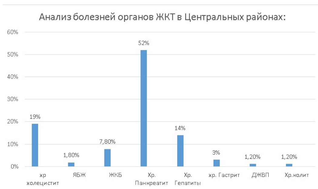
Рис. 2. Анализ болезней органов ЖКТ в Центральном районе