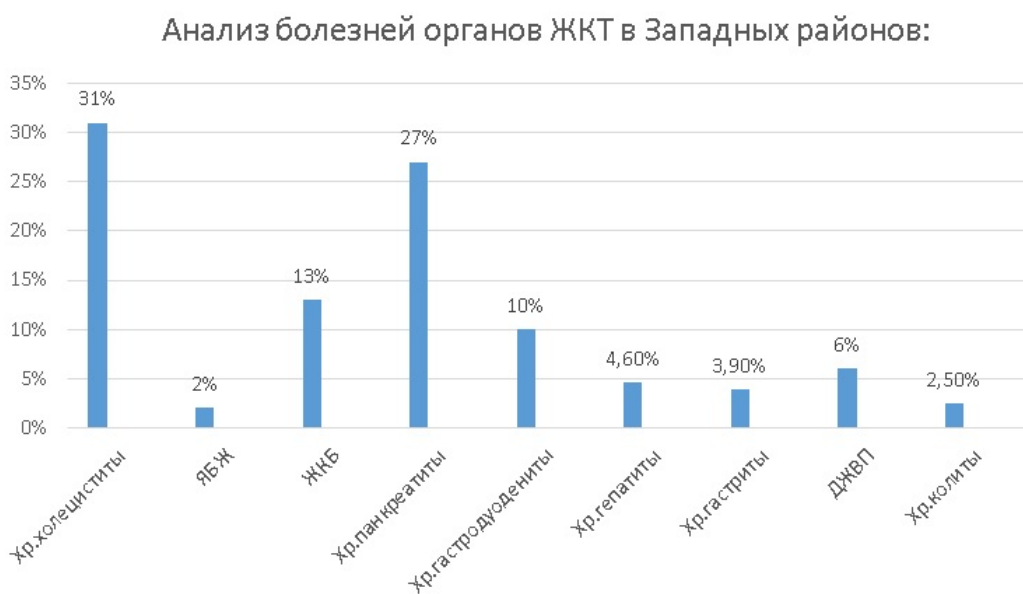
Рис. 4. Анализ болезней органов ЖКТ в Западных районах