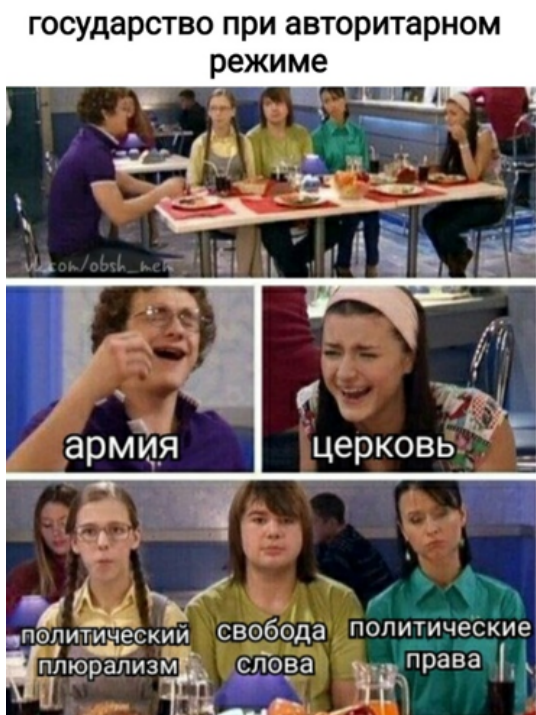
Рис. 2. Авторитарный политический режим