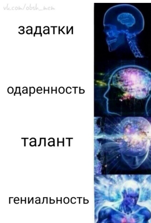
Рис. 3. Использование шаблона "Сверхразум"