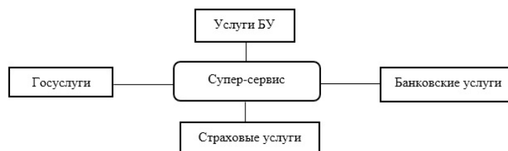
Рис. 1. Экосистема супер-сервиса