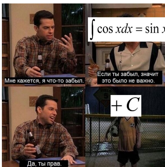
Рис. 2. Коллаж из кадров многосерийного фильма "Два с половиной человека" Рис. 2. Коллаж из кадров многосерийного фильма "Два с половиной человека"