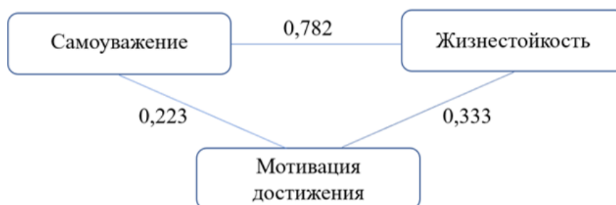
Рис. 4. Модель взаимосвязи самоуважения, жизнестойкости и мотивации достижения у студентов