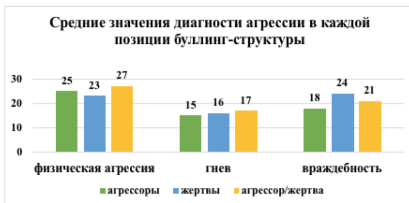
Рис. 3. Средние значения диагностики агрессии в каждой позиции буллинг-структуры по методике Басса-Перри