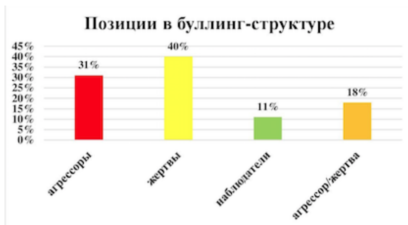
Рис. 1. Позиции в буллинг-структуре по методике Е. Г. Норкиной