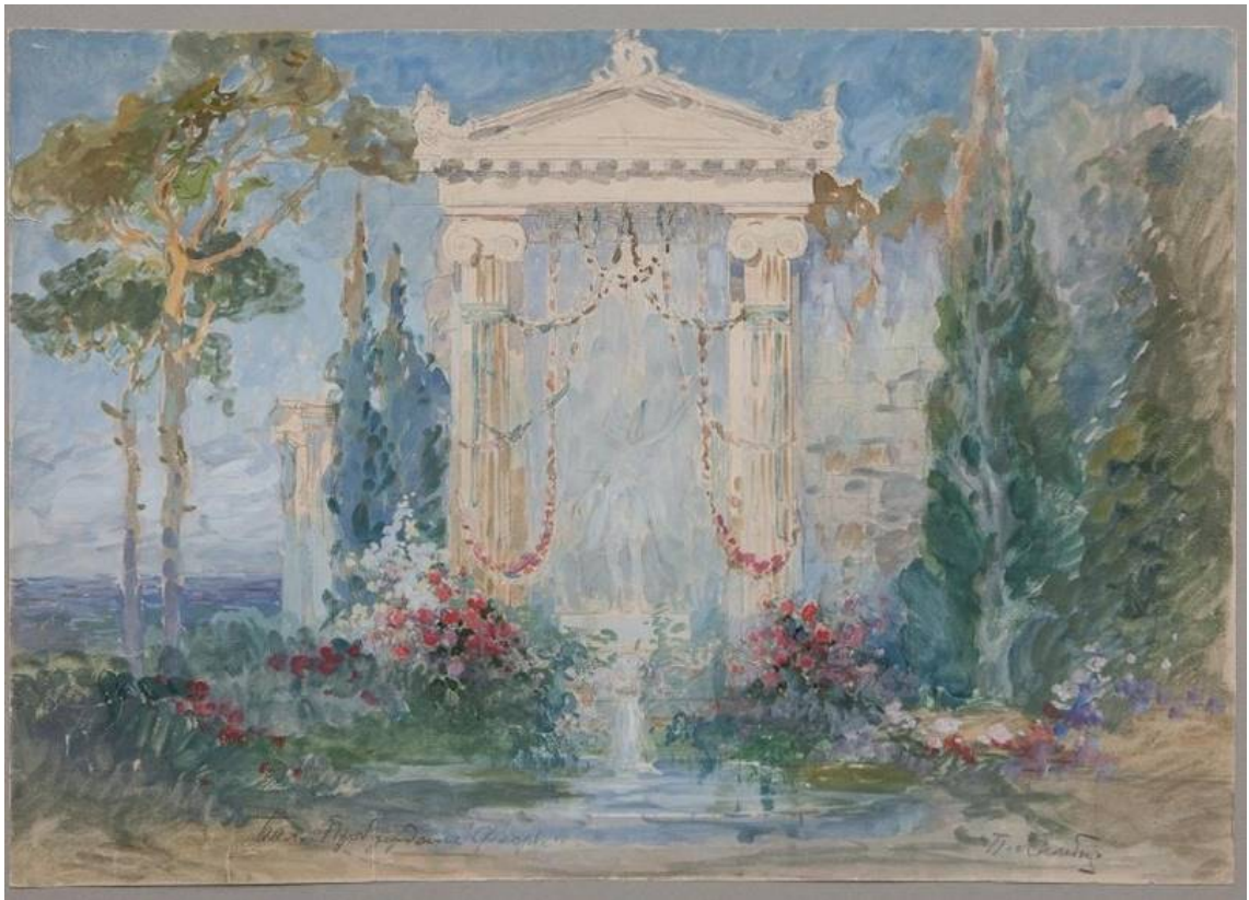
Рис. 1. П.Б.Ламбин. Эскиз декорации к балету "Пробуждение Флоры". 1894. Материал: бумага, карандаш, акварель, белила