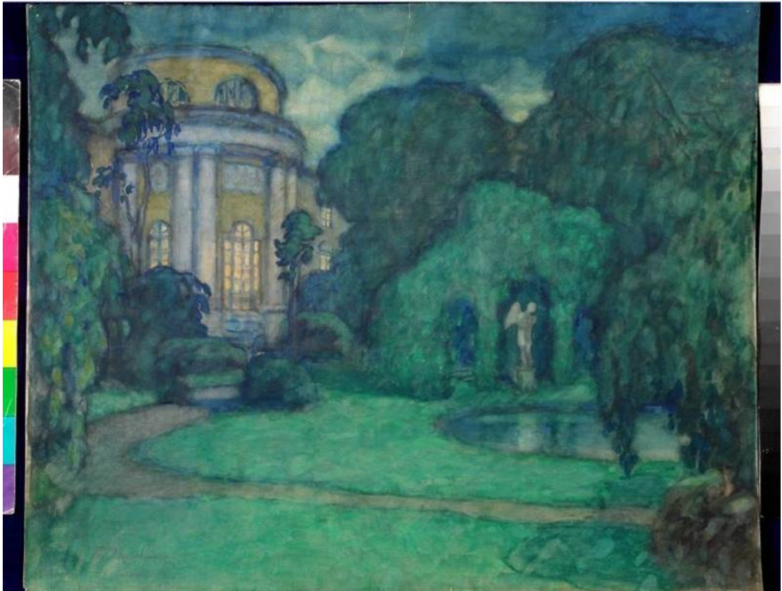
Рис. 2. П.Б. Ламбин. Эскиз декорации к балету "Ненюфар". 1890. Материал: бумага, акварель