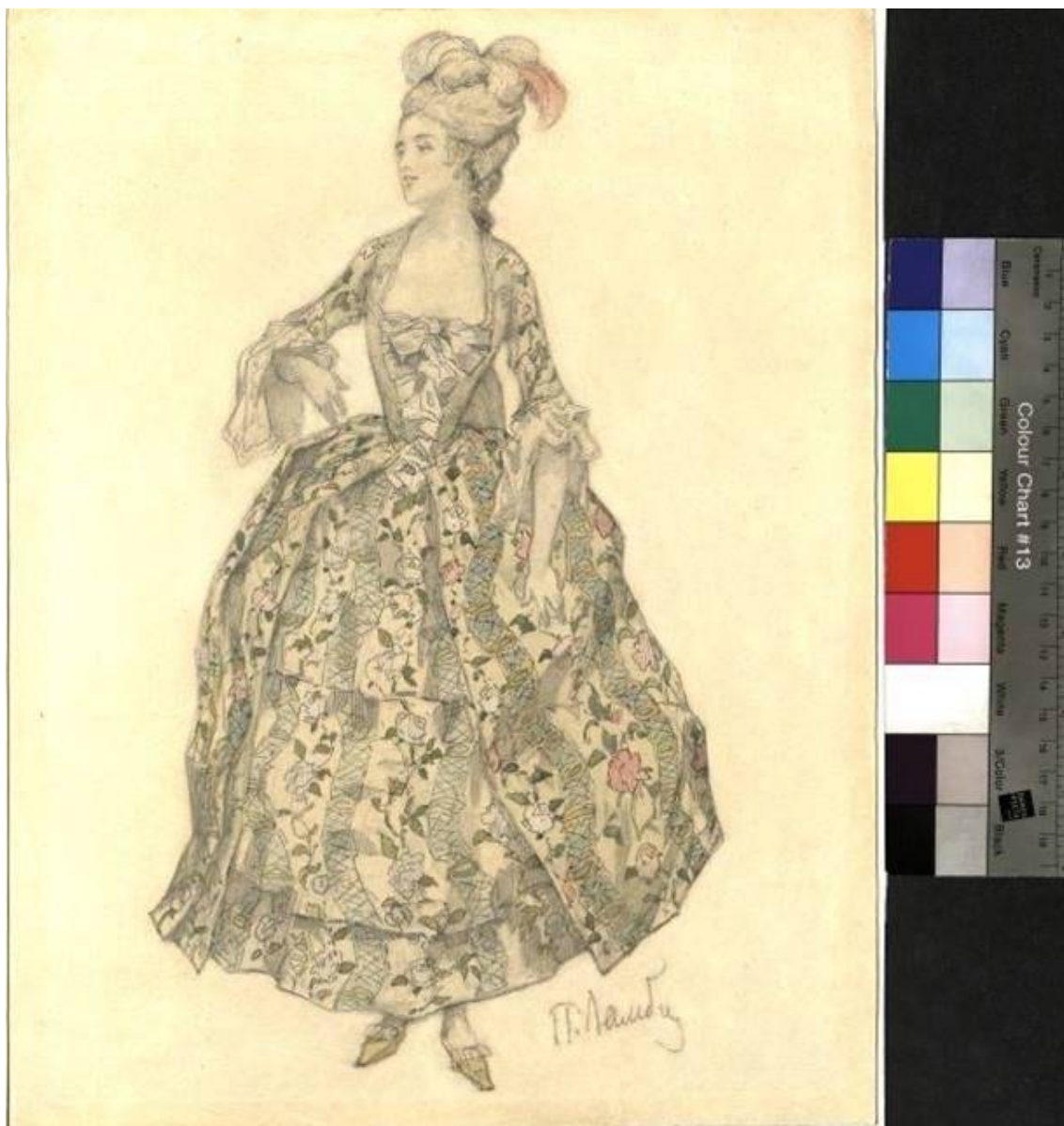
Рис. 15. П.Б. Ламбин. Эскиз костюма к балету «Времена года». 1900. Материал: акварель, карандаш