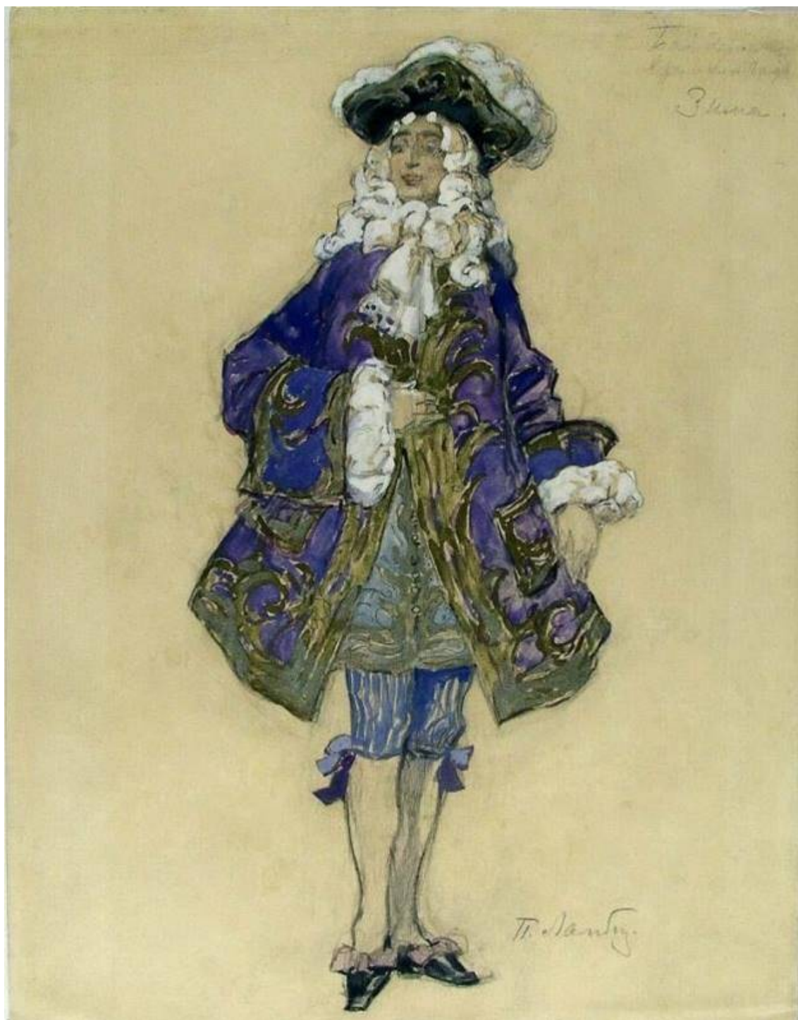
Рис. 6. П.Б. Ламбин. Эскиз костюма к балету "Времена года". 1900. Материал: бумага, белила, акварель