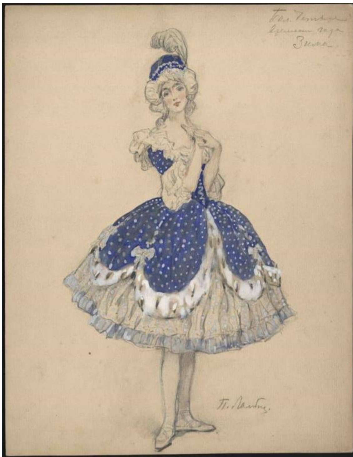
Рис. 5. П.Б. Ламбин. Эскиз костюма к балету "Времена года". 1900. Материал: бумага, белила, акварель