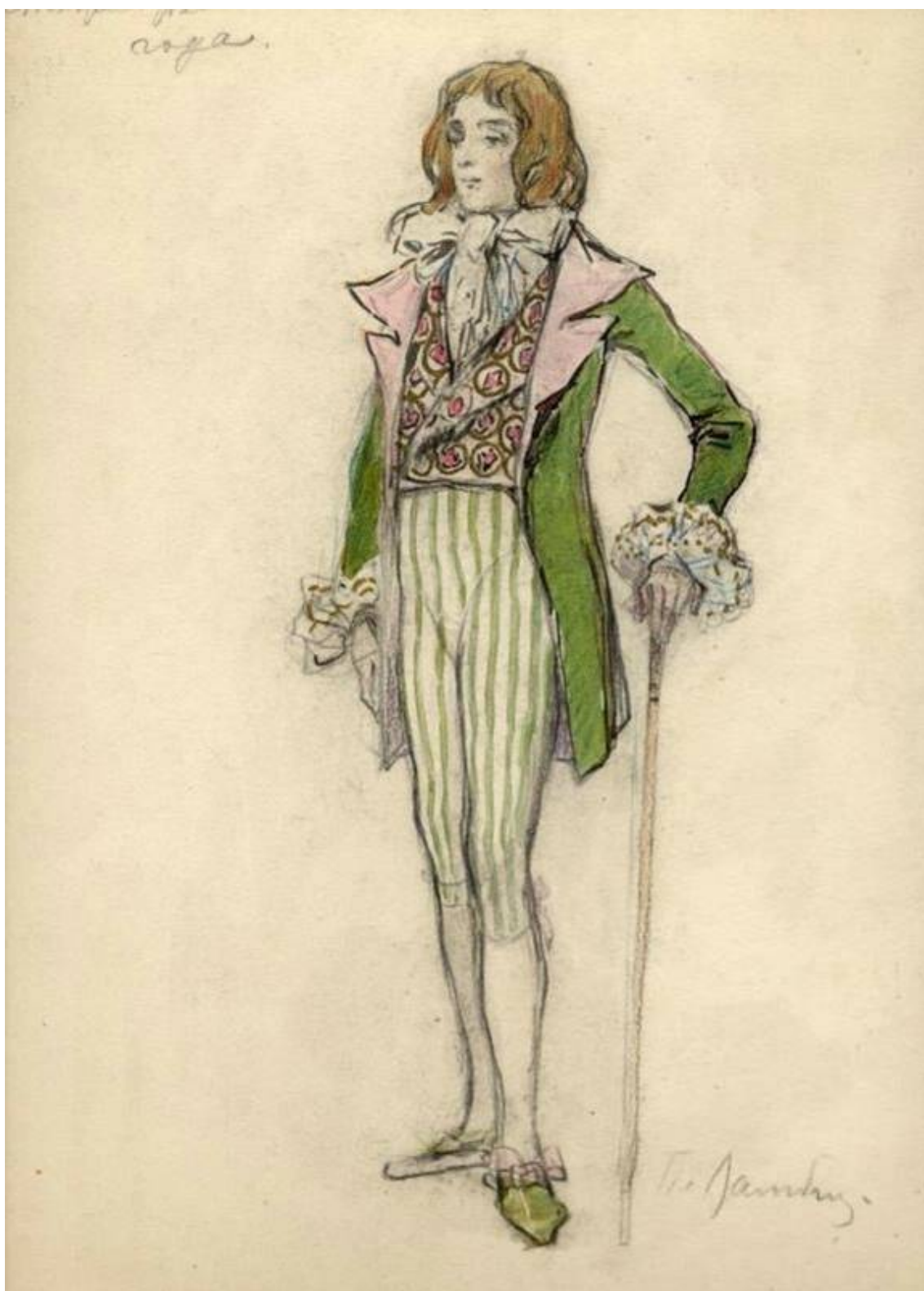
Рис. 9. П.Б. Ламбин. Эскиз костюма к балету "Времена года". 1900. Материал: бумага, картон, акварель