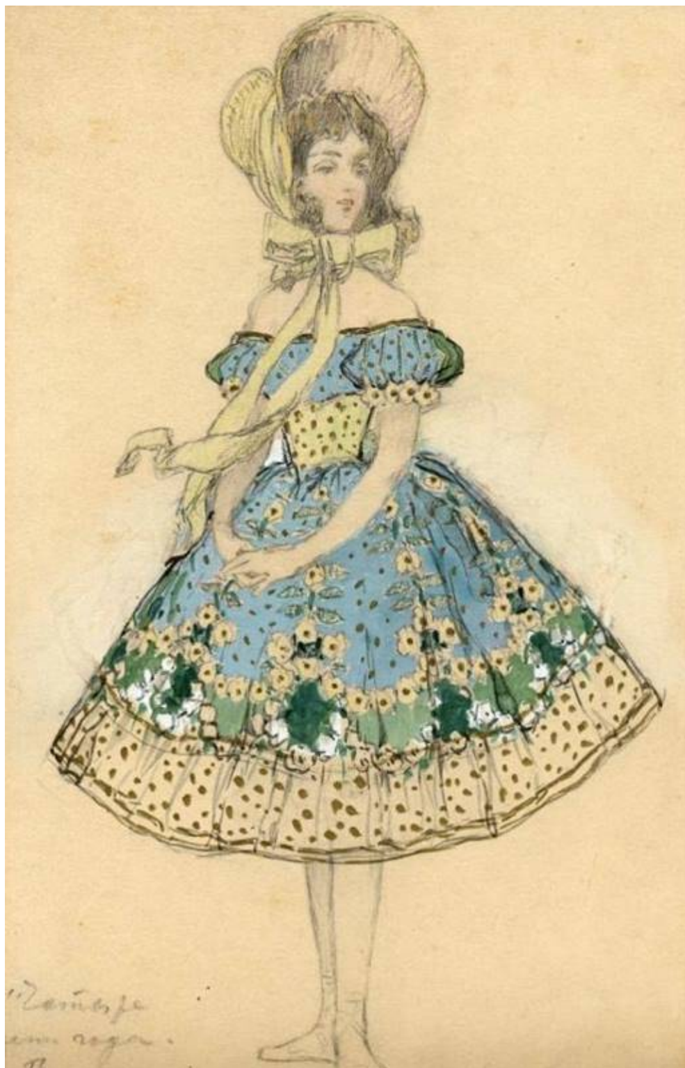
Рис. 7. П.Б. Ламбин. Эскиз костюма к балету "Времена года". 1900. Материал: бумага, белила, акварель