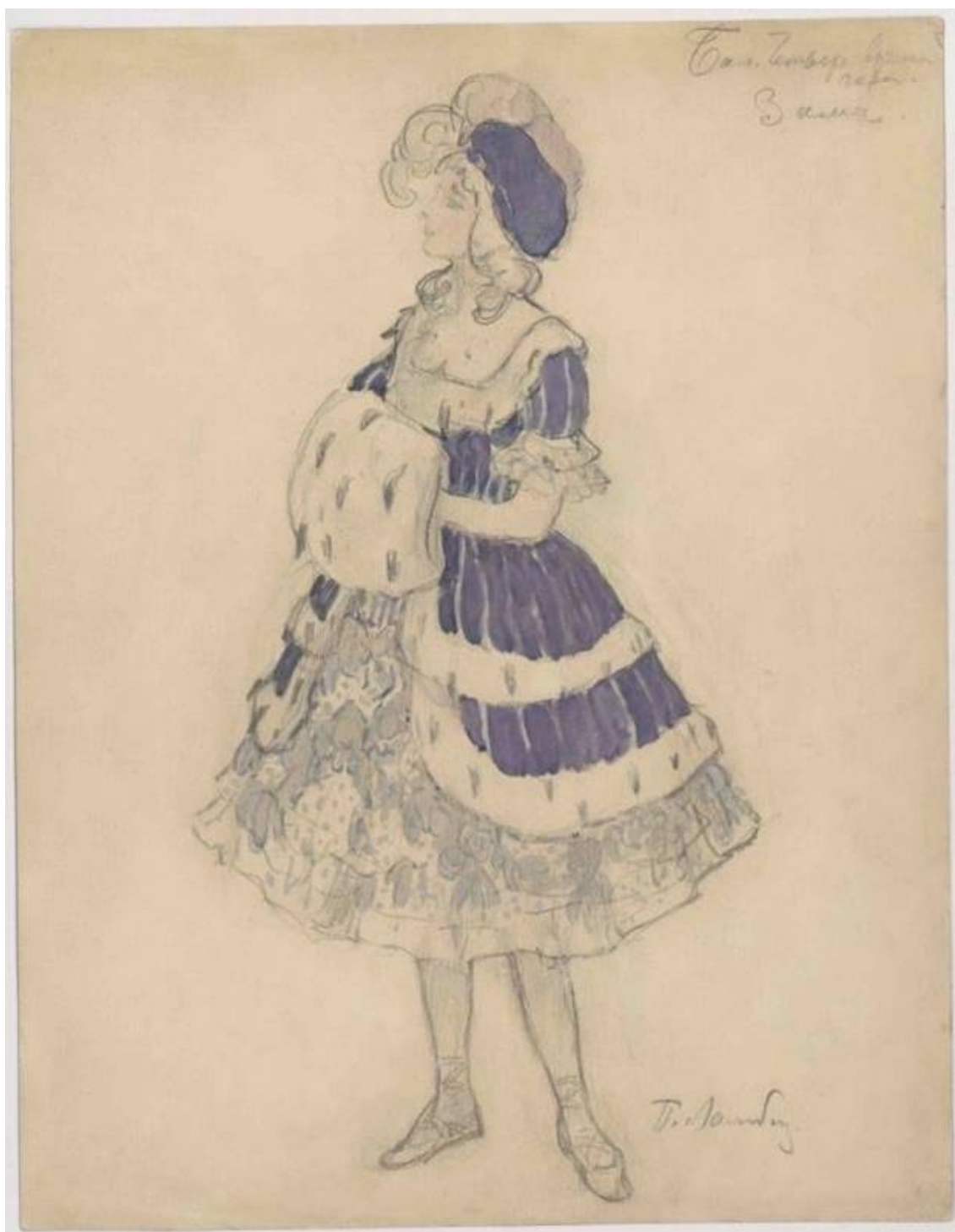
Рис. 4. П.Б. Ламбин. Эскиз костюма к балету "Времена года". 1900. Материал: бумага, акварель