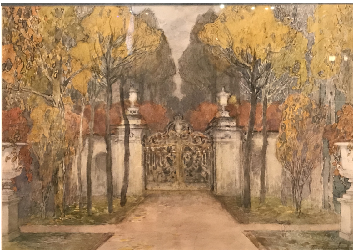
Рис. 3. П.Б. Ламбин. Эскиз декорации к балету "Времена года". 1900. Материал: картон, акварель, бронзовая краска, карандаш