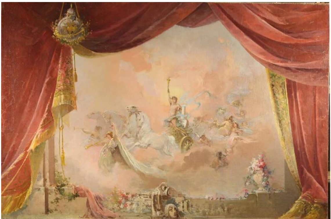
Рис. 12. П.Б. Ламбин. Эскиз занавеса "Торжество искусства" к балету "Прелестная жемчужина". 1896. Материал: холст, масло