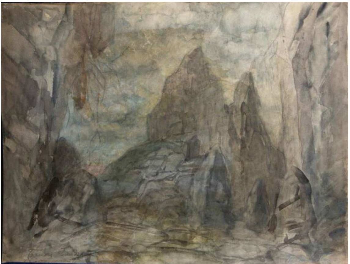
Рис. 14. П.Б. Ламбин. Эскиз декорации к балету "Баядерка". 1900. Материал: бумага, жировой карандаш, акварель, цветной карандаш