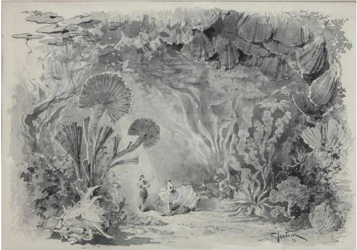
Рис. 11. П.Б. Ламбин. Эскиз декорации к балету "Прелестная жемчужина". 1896. Материал: картон, акварель