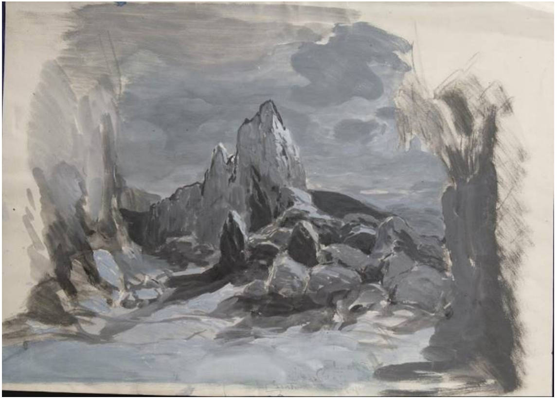
Рис. 13. П.Б. Ламбин. Эскиз декорации к балету "Баядерка". 1900. Материал: бумага, жировой карандаш, акварель, гуашь