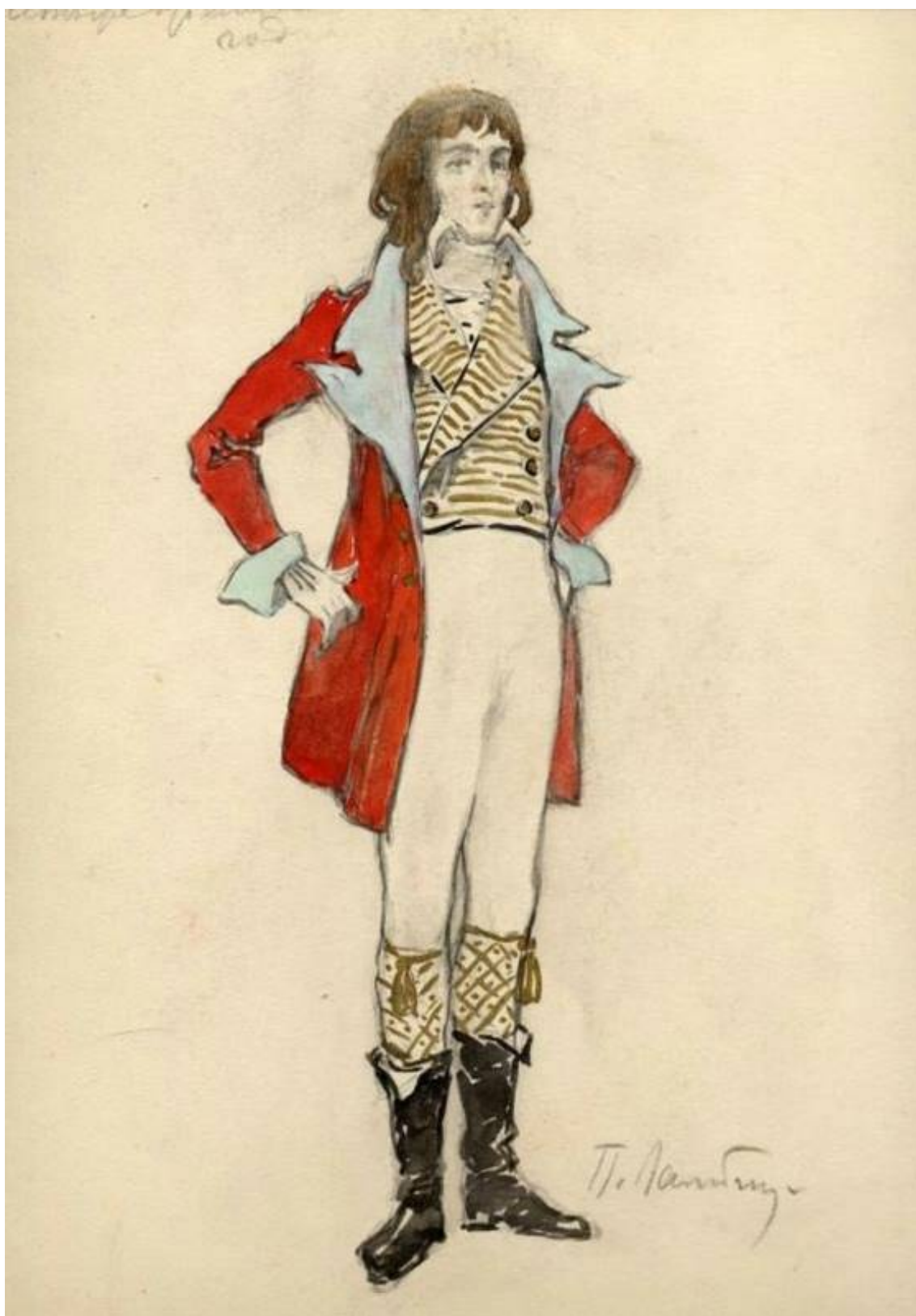
Рис. 8. П.Б. Ламбин. Эскиз костюма к балету "Времена года". 1900. Материал: бумага, акварель