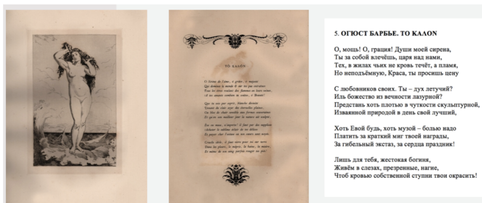
Рис. 5. А. Джакомотти. К Калоне. По мотивам сонета О. Барбье. 1868. Бумага, офорт.