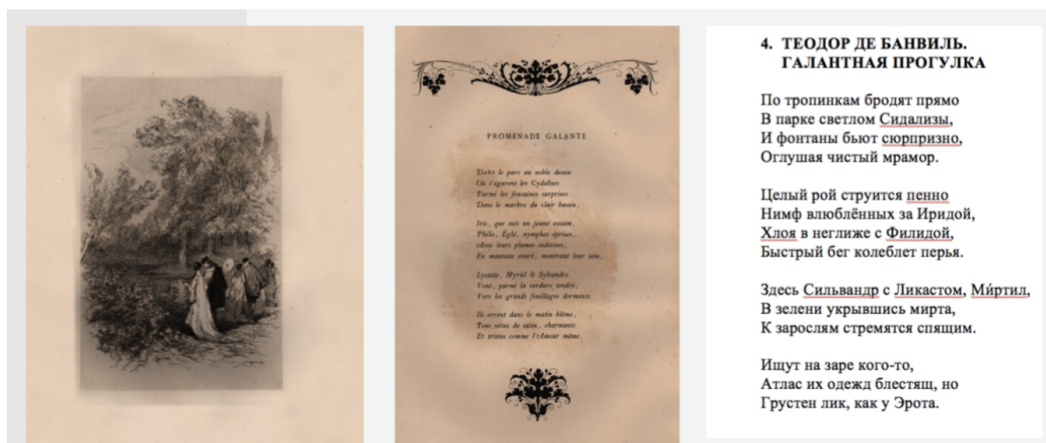
Рис. 4. Э. Морен. Галантная прогулка. По мотивам сонета Т. де Банвиля. 1868.