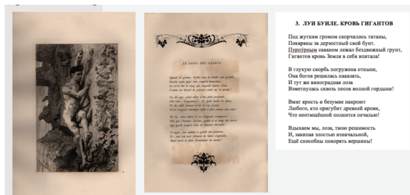
Рис. 3. Нантейл С. Кровь гигантов. По мотивам сонета 1868. Бумага, офорт