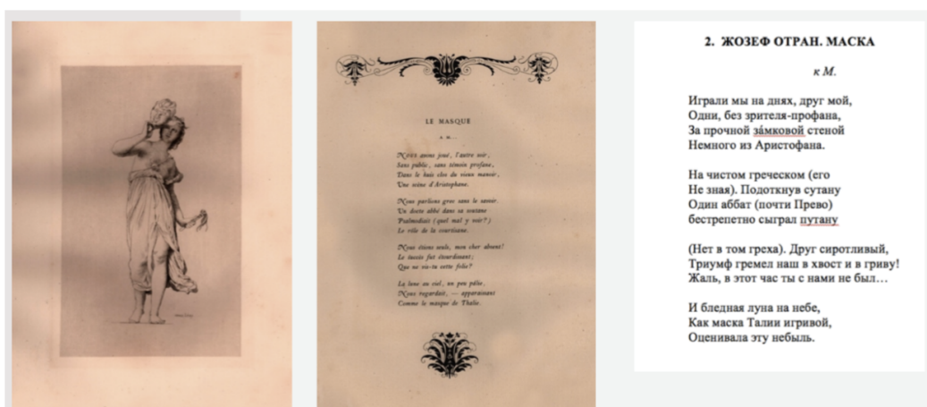
Рис. 2. Леви Э. Маска. По мотивам сонета Отрана Ж. 1868. Бумага, офорт