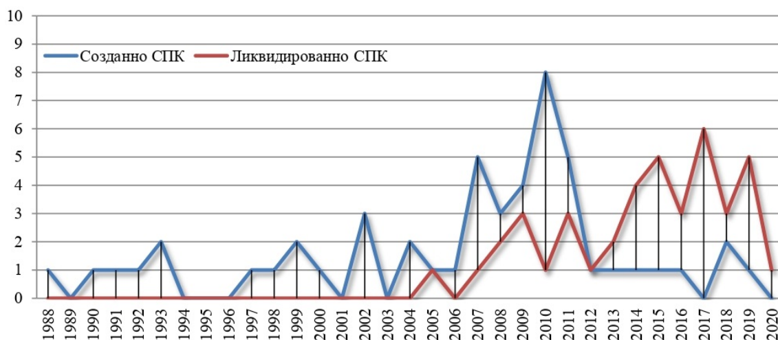
Рис. 1. Динамика организации и ликвидации сельскохозяйственных производственных кооперативов в отрасли пчеловодства Российской Федерации в период с 1988-2020 гг.