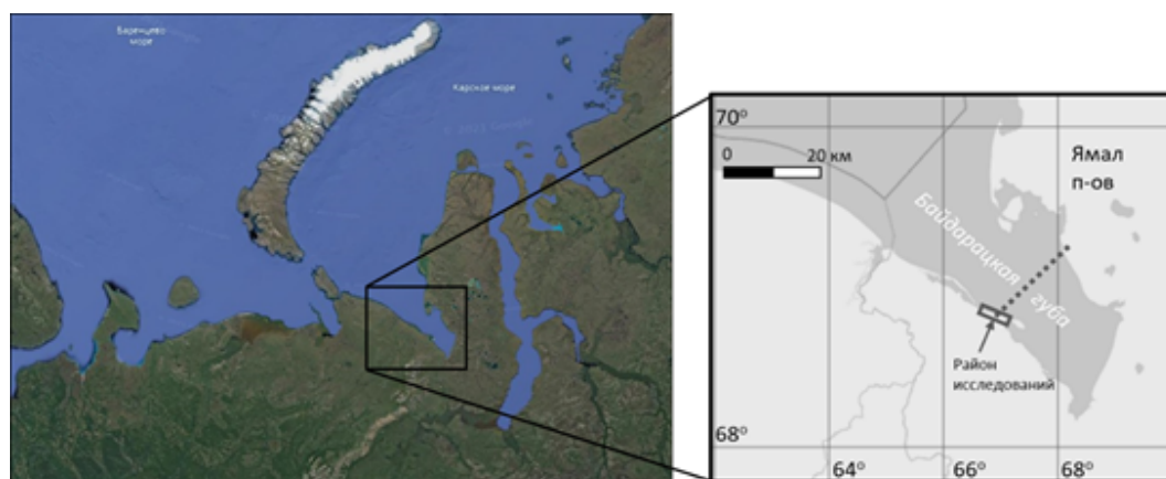
Рис. 1. Расположение района исследований.