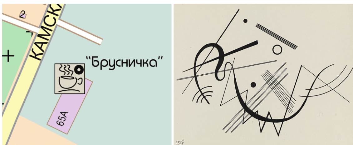
Рис. 1. Пример условного знака заведения питания и исходной картины