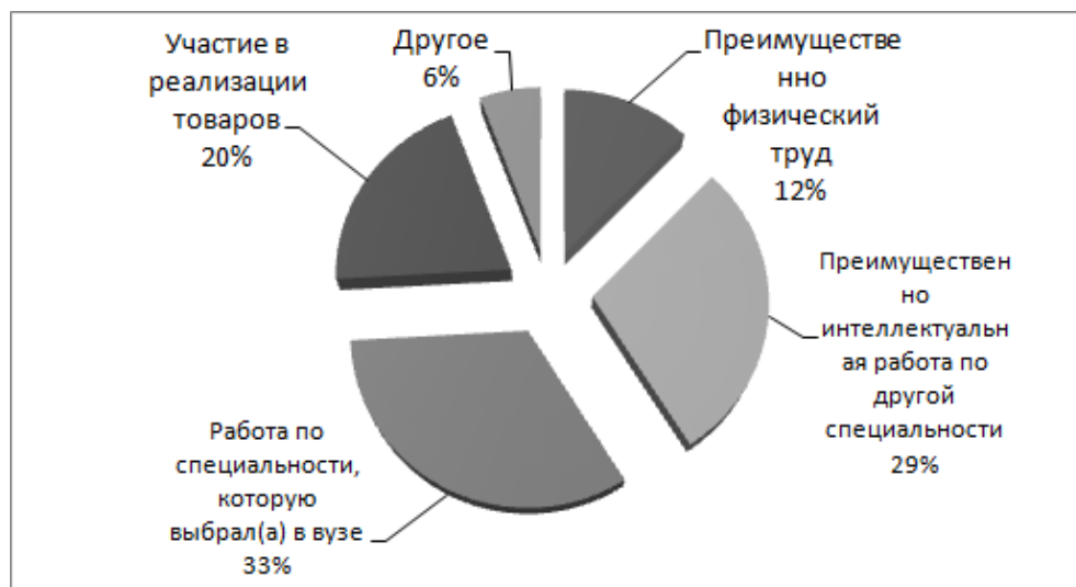
Рис. 2. Характер занятости во время совмещения учебы и работы, %