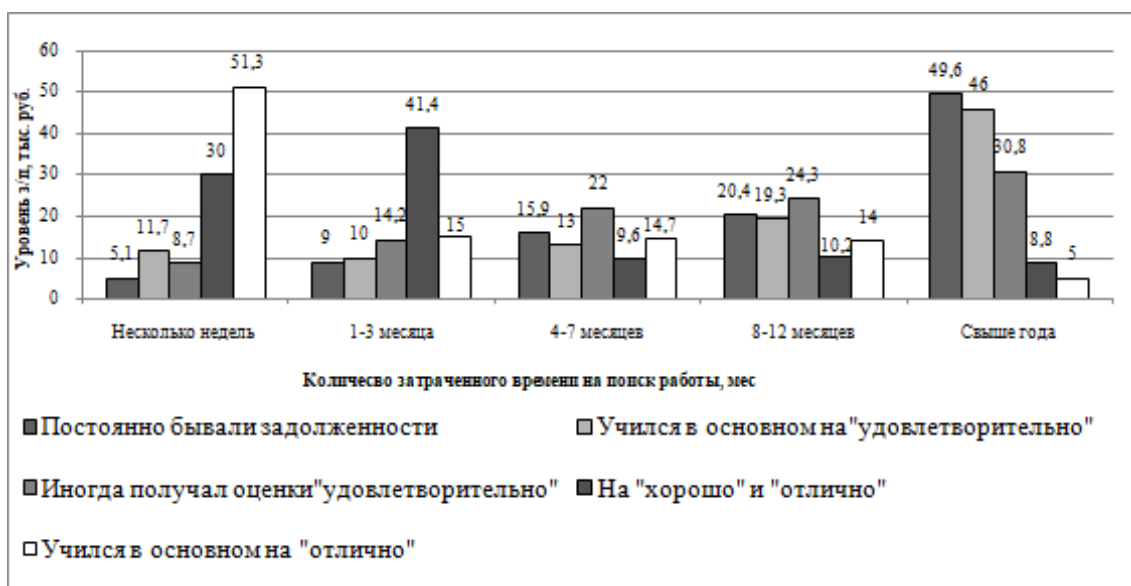
Рис. 4. Распределение сроков поиска работы в зависимости от успеваемости в вузе, %