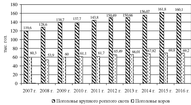
Рис. 1. Рис. 1 Динамика поголовья крупного рогатого скота, в том числе коров, в Республике Тыва за 2007-2016 гг.