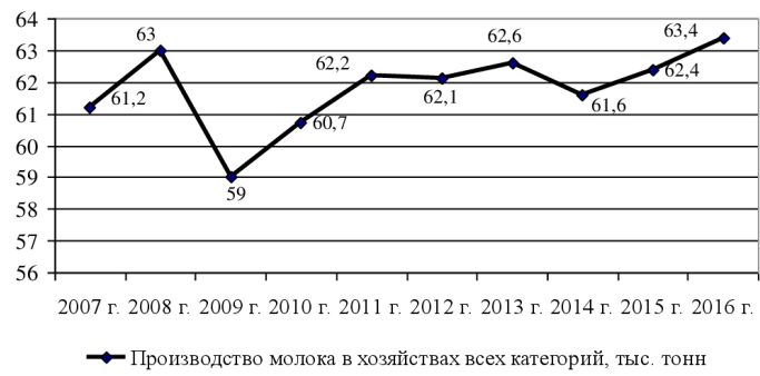
Рис. 2. Рис. 2. Производство молока в хозяйствах всех категорий в Республике Тыва за 2007-2016 гг., тыс. тонн