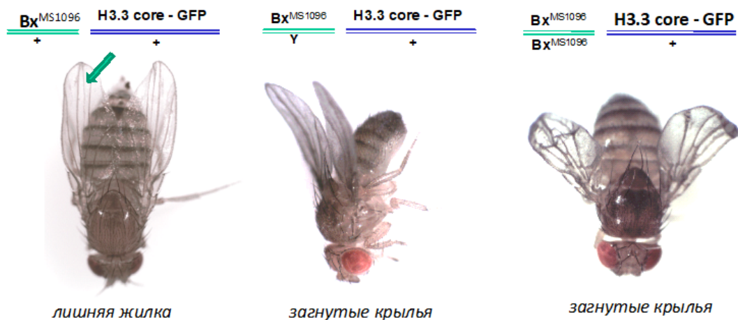
Рис. 2. Фенотипические проявления, обусловленные экспрессией гистона H3.3-core-GFP под действием GAL4-драйвера Bx[MS1096]. Стрелка указывает на лишнюю продольную жилку на крыле