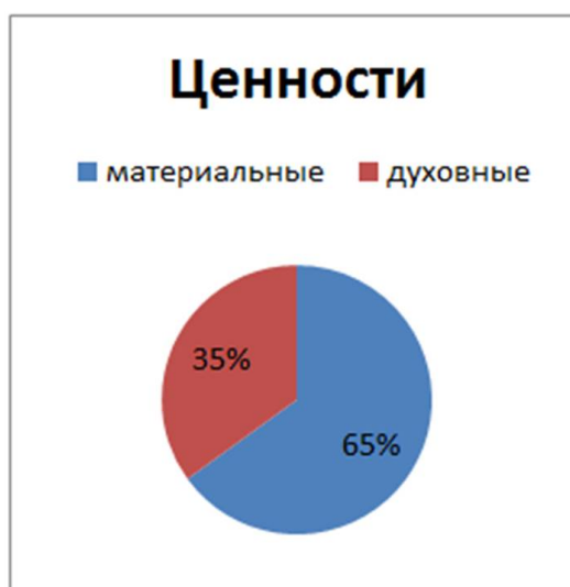
Рис. 1. рисунок 1