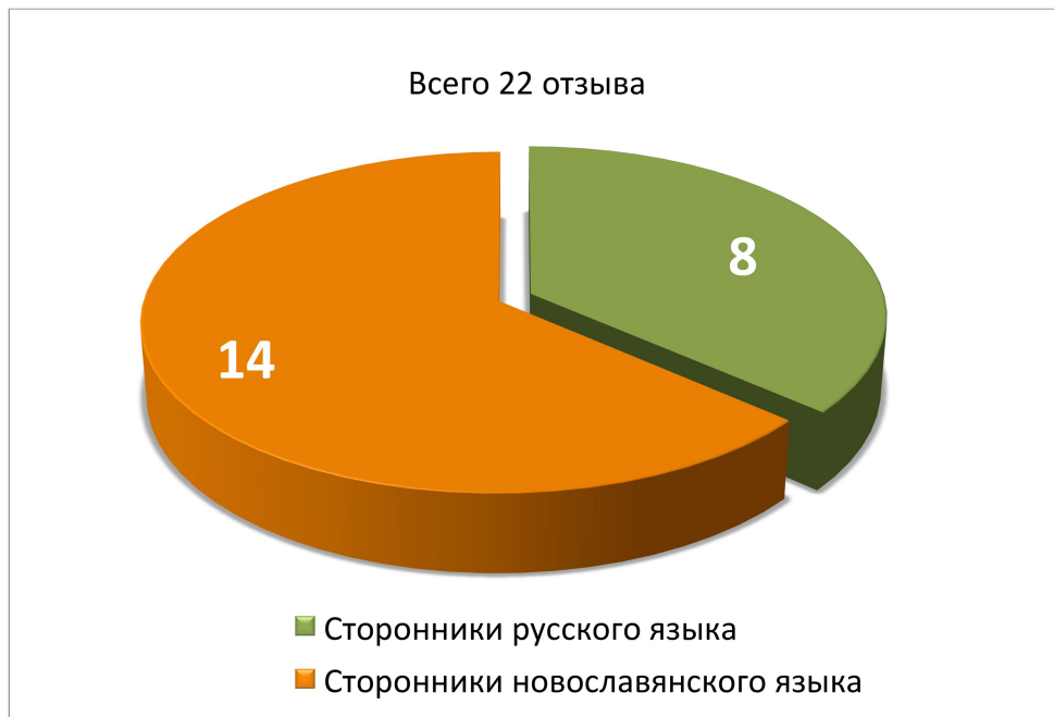
Рис. 2. Отзывы епархиальных архиереев о богослужебном языке.