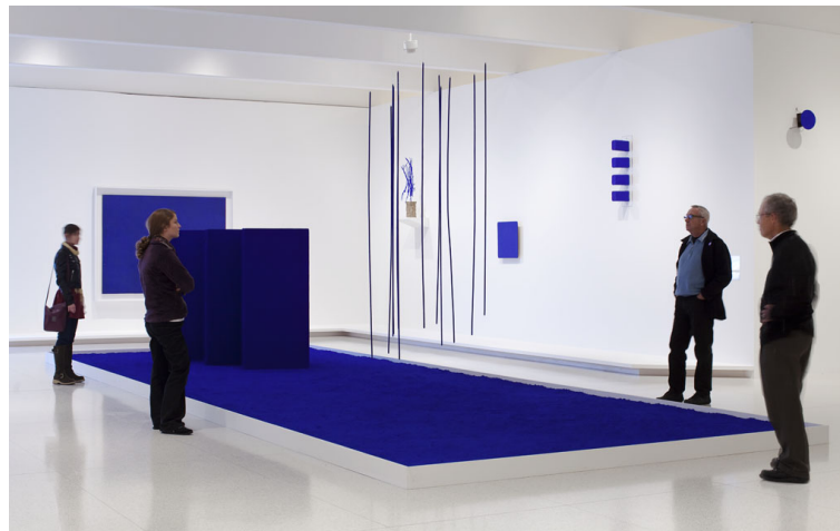
Рис. 2. Выставка Ива Кляйна в Музее Хиршхорн, Вашингтон, США (2010 г.)