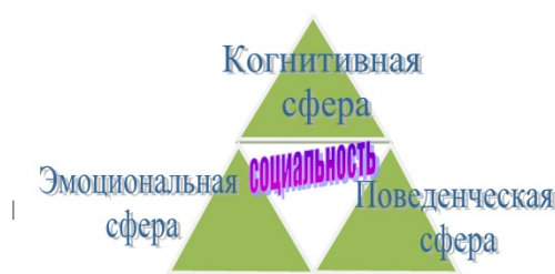
Рис.1 Структура социальности как интегративное качество личности