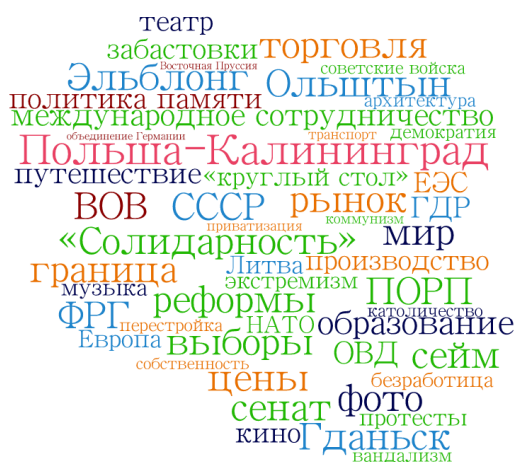
Рис. 1. Рис 1. Инфографическое изображение наиболее часто встречающихся тегов.