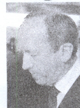
Председатель правительства Питкевич