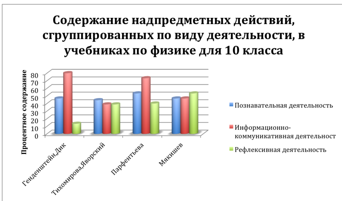
Рис. 3. Содержание надпредметных действий, сгруппированных по виду деятельности, в учебниках по физике для 10 класса