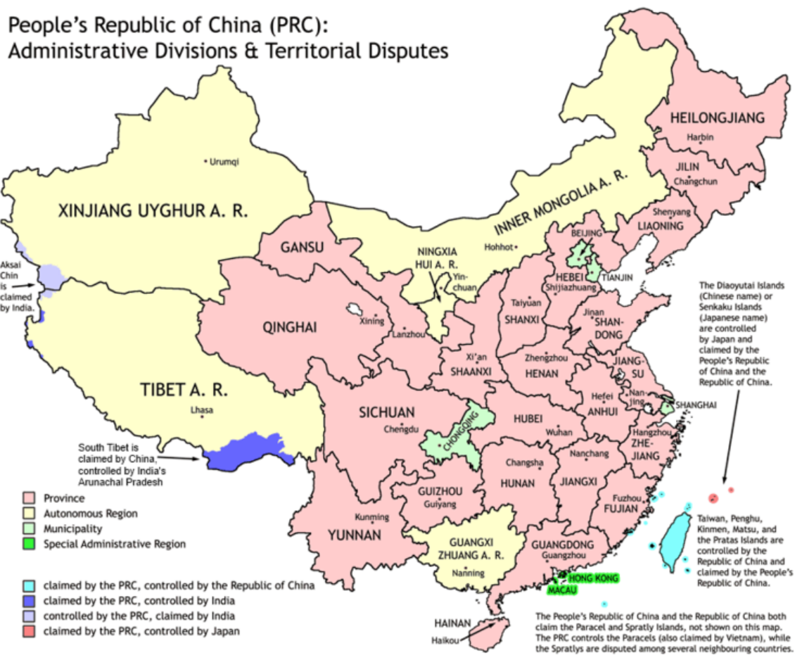
Рис. 1: Административное устройство КНР