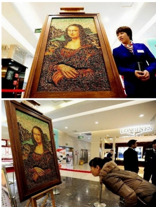
Рис. 4: "Мона Лиза" из драгоценных камней