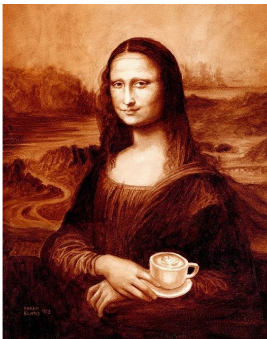
Рис. 7: Кофейная "Мона Лиза"