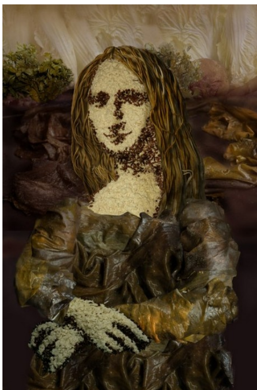
Рис. 6: "Мона Лиза" из тофу, риса и морской капусты