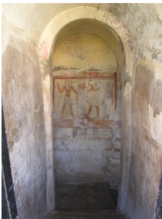
Рис. 3: Фреска в египетском стиле (лестничная клетка гробницы №2)