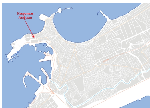
Рис. 1: Карта Александрии с указанием места расположения некрополя Анфуши. (Карта создана с использованием материалов сайта http://www.cealex.org )