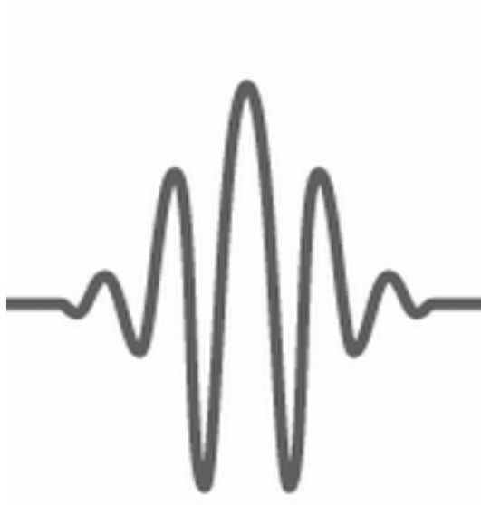
Рис. 1: Вейвлет Морле