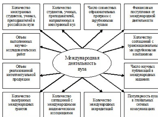
Рис. 1: Индикаторы международной деятельности вуза