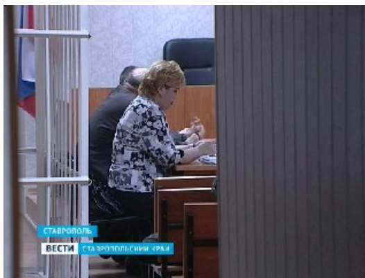
Рис. 4: съемка зала судебных заседаний