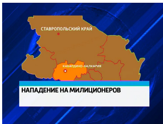
Рис. 6: Карта