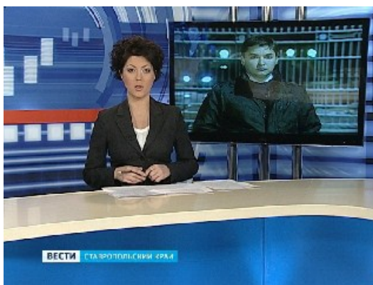
Рис. 2: Подводка ведущего и корреспондент на плазме