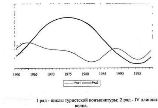
Рис. 1: Взаимодействие длинных волн Кондратьева и циклов туристской инфраструктуры