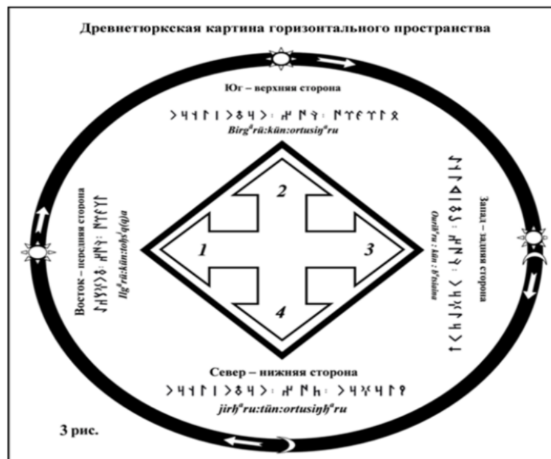
Рис. 3: 3 рис.